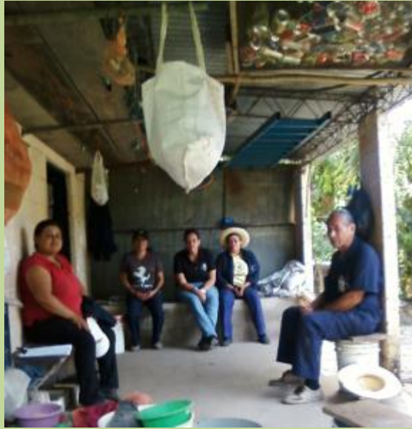
Personal de Vivero haciendo el Plan de trabajo.